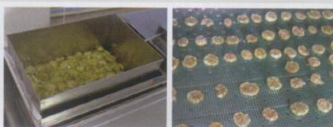
Figura 3 - Etapa do processo osmótico combinado com secagem