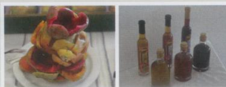
Figura 6 - Epidermes de várias cores e diferentes tipos de licores

subproduto obtido pode ser utilizado para a alimentação animal.