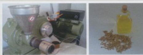
Figura 5 - Equipamento de extração a frio de óleo de sementes e óleo e sementes