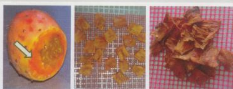
Figura 2 - Mesocarpo de figo da-índia em fresco e após secagem