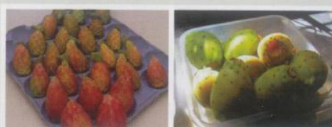
Figura 1 - Figo-da-índia para consumo em fresco, em diferentes tipos de embalagem

O produto final revela sabor muito agradável, boa textura, considerando-se interessante, com possibilidade de implementação, através da incorporação em flocos de cereais e em "snacks" para aperitivos.